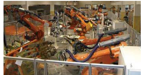
Uma linha de produção de carroceria automotiva testada pela KUKA Brasil antes do embarque.

servidor OPC (OLE para Controle de Processo). Isto realça a força da Siemens PLM Software como um provedor de soluções com ferramentas abertas.”