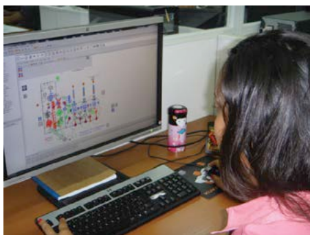
Uma engenheira da Kuka Brasil utilizando o Plant Simulation para analisar a capacidade de produção.

Brasil é agora um dos principais integradores de linha de produção da América do Sul.