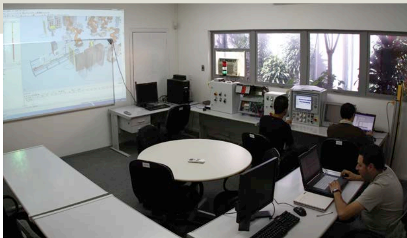
Engenheiros da Kuka Brasil utilizam o Process Simulate no laboratório de comissionamento virtual da companhia.