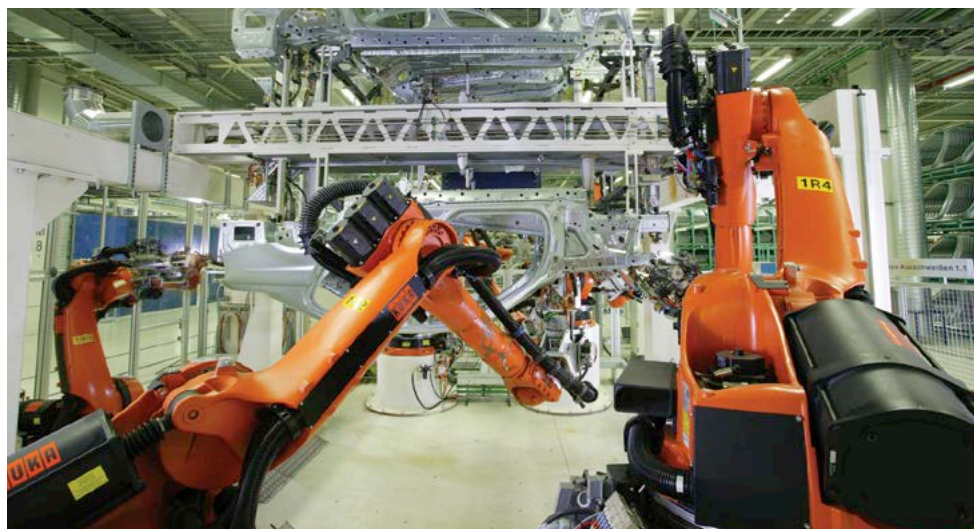
Uma linha de produção de carroceria automotiva entregue pela KUKA Brasil.

A KUKA Brasil foi fundado em 1998, Tendo feito um importante investimento em capacitação da engenharia, as soluções da empresa estão presentes agora em praticamente em todos os fabricantes automotivos em todo o Brasil. Recentemente a KUKA Brasil apresentou suas tecnologias de automação para empresas de pequeno e médio porte nos mercados aeroespacial e indústrias em geral. Como resultado, a empresa dobrou seu tamanho em apenas três anos. Com 170 funcionários, a KUKA